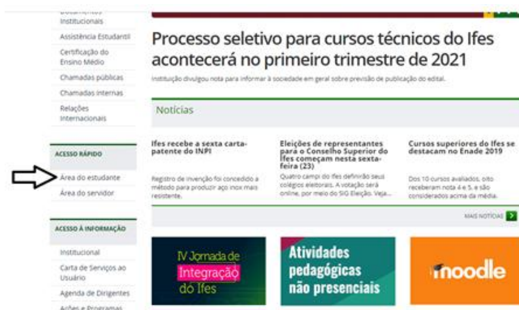
Figura 1.1 - Área do Estudante - Acesso Rápido

No site do Ifes ( https://ifes.edu.br/ ), click em ACESSO RÁPIDO, depois em Área do estudante (figura 1.1).