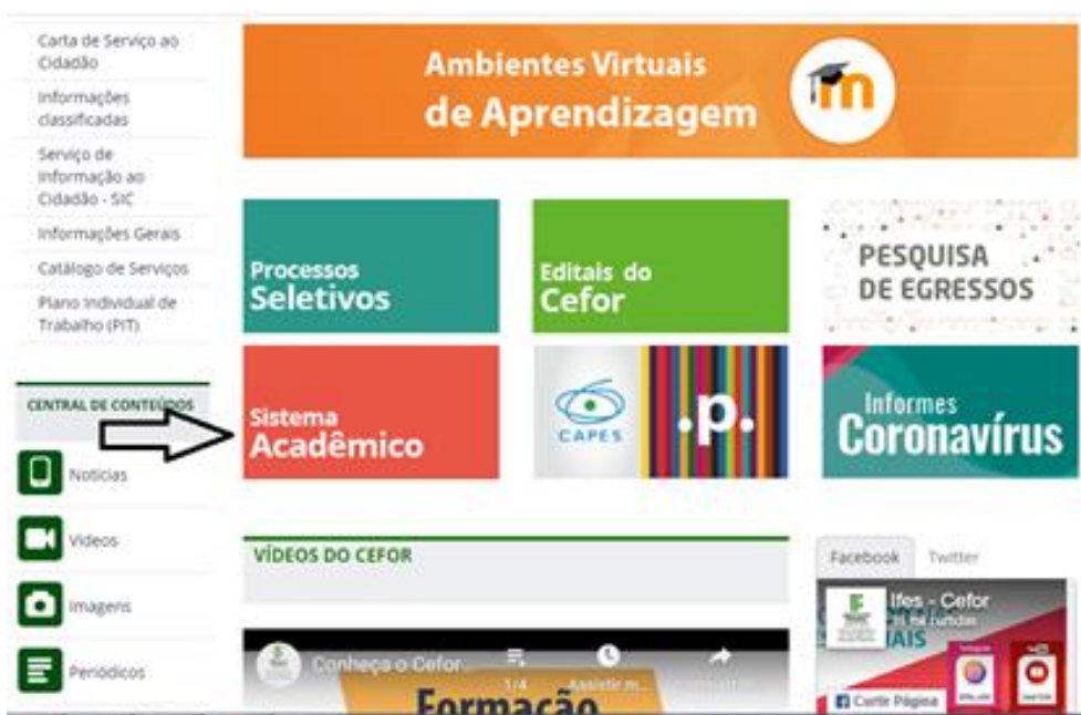
Figura 1.3 – Acesso ao Sistema Acadêmico pelo site do Cefor ( https://cefor.ifes.edu.br/ )

Ou no site do Cefor, Clicar no banner Sistema Acadêmico (figura 1.3).