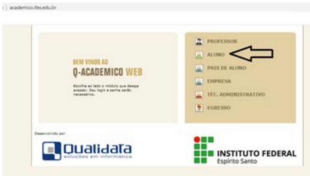
Figura 1.4 – Acesso como aluno

Digite o Login e Senha nos campos indicados (figura 1.5). O Login do Aluno será sempre seu número de matrícula.