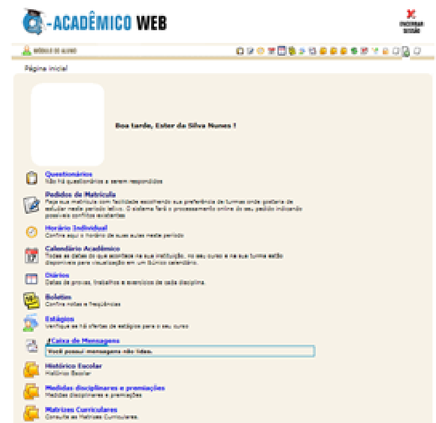
Figura 1.6 – Página inicial do Acadêmico

Digite sua matrícula e clique em Enviar. Você receberá um email no endereço disponibilizado na inscrição com as instruções para obter sua senha. Estando tudo certo, aparecerá a tela da figura 1.7