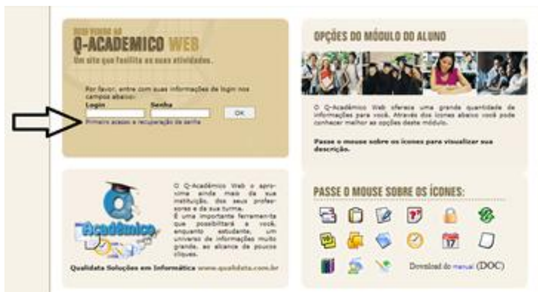
Figura 1.5 – Login e senha

Digite o Login e Senha nos campos indicados (figura 1.5). O Login do Aluno será sempre seu número de matrícula.