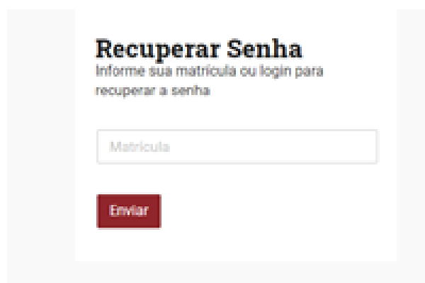
Figura 1.6 – Tela de recuperar senha ou 1º acesso

Digite sua matrícula e clique em Enviar. Você receberá um email no endereço disponibilizado na inscrição com as instruções para obter sua senha. Estando tudo certo, aparecerá a tela da figura 1.7